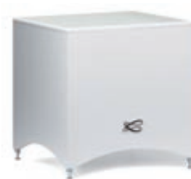
Satelliten 17 subwoofer