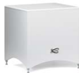
Santorin 17 caisson de graves