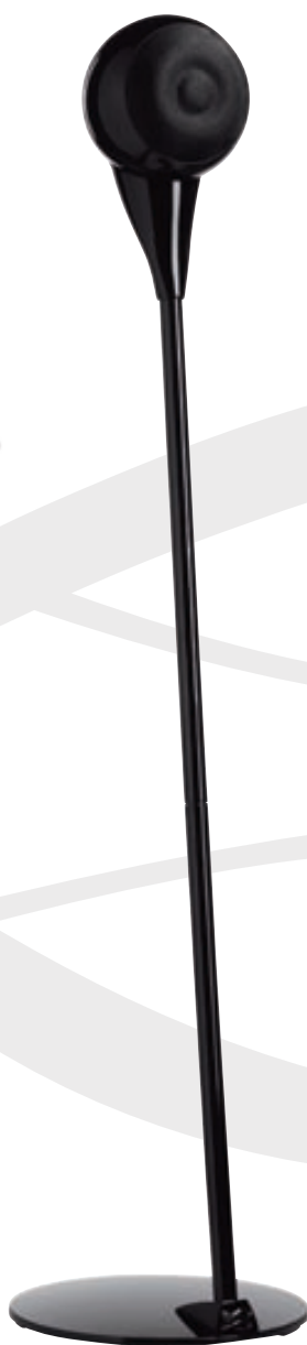
EOLE 2 MIT STANDFUSS