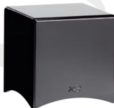
SANTORIN 21 CAISSON DE GRAVES