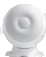
EN MODE À POSER