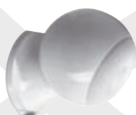
EN MODE MURAL