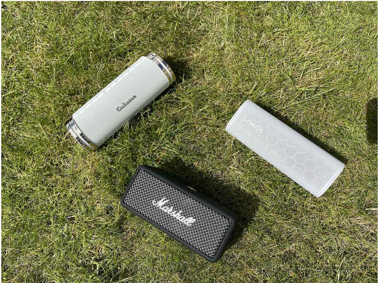
Les 3 enceintes Bluetooth Swell Cabasse, Emberton Marshall et Sonos Roam .

À l'écoute les 3 enceintes Cabasse, Marshall et Sonos ont une musicalité proche. Ce n'est pas surprenant, chacune de ces marques emblématiques maîtrise son sujet, depuis 1952 pour le français Cabasse et depuis 1962 pour l'anglais Marshall . L'américain Sonos fait figure de jeune société avec sa création en 2002. Comparés aux autres leaders des enceintes nomades Bluetooth, que sont Bose, JBL et Sony, ma préférence va sur les trois marques de ce comparatif pour leur justesse dans le rendu sonore. La Swell de Cabasse, l'Emberton de Marshall et la Roam de Sonos sont les enceintes que j'aime emmener pour sonoriser mes vacances. Peu encombrantes et avec une autonomie de 10 à 20 h, elles prennent place dans un petit salon ou une chambre avec discrétion. Elles savent toutes les trois jouer mes playlists sans surjouer le grave. En poussant le volume sonore, elles créent une ambiance festive pendant les vacances. Cependant, ne comptez pas les faire jouer à 100 % de leur volume sonore, chacune d'elle sature au delà des 90 % avec une forte distorsion. En jouant sur la puissance sonore, nous constatons qu'il y a un palier où les haut parleurs sont au delà de leur limite. Pas d'inquiétude, elles font le job pour leur taille, une zone