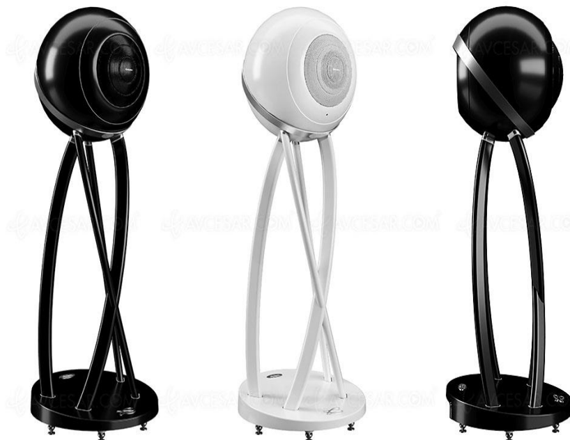
La etiqueta Stream

El altavoz Cabasse Pearl Pelegrina, llamado así en homenaje a una rara perla de 55 quilates descubierta en 1913 apodada la Incomparable, tiene la forma de una bola de 48 cm de diámetro, cercana al concepto de esfera pulsante, encaramada en un gran soporte que lleva toda la electrónica (incluido un Dac de 768 kHz / 32 bits) y conectores (en su base). El conjunto culmina a casi 1,3 m de altura. Quienes más lo saben saben que el Cabasse Pearl Pelegrina es un digno descendiente de los altavoces Cabasse Ocean System y el Cabasse Sphère, un altavoz monumental con un rendimiento absolutamente extraordinario. Y como todo el hardware de la familia Stream, tiene una excelente conectividad.